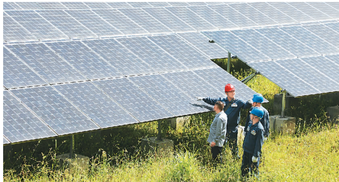
▲近年来，贵州省铜仁市推动荒坡山地效益最大化，让光伏清洁能源成为群众增收的“绿色银行”。图为3月25日，在铜仁市印江县杉树镇孟郊村光伏发电项目基地，南方电网贵州铜仁印江供电公司工作人员为光伏电站进行设备检查。

国家能源局有关负责人表示，“十四五”时期，中国将加快构建新发展格局，新型工业化和城镇化深入推进，扩大内需战略深入实施，能源