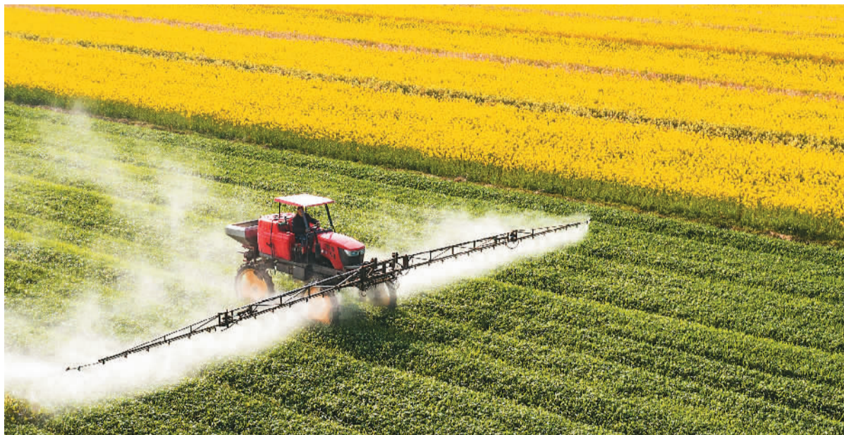
三月二十三日，江苏省海安市雒周现代农业园内，村民驾驶植保机在小麦田间进行药物喷洒作业。

粮食尽管连年丰收，但并非可以高枕无忧。受去年罕见秋汛影响，冀晋鲁豫陕5省冬小麦晚播面积1.1亿