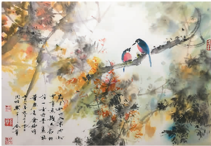
《金婚》冯骥才 顾同昭绘