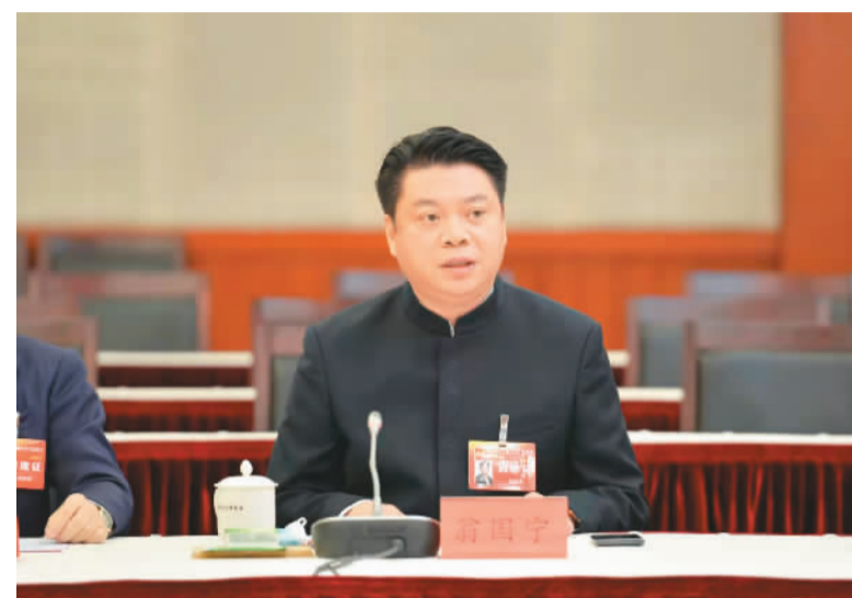
翁国宁列席福建省十三届人大六次会议。