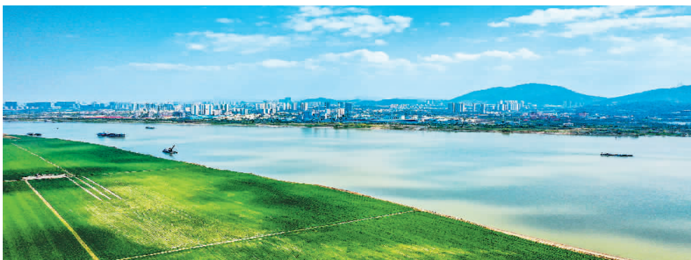
近日,安徽省铜陵市老洲乡,长江波光粼粼,岸边绿地如茵,美不胜收。近年来,铜陵市加强长江生态环境保护,推进生态复绿和岸线修复,绿色发展成效显著。