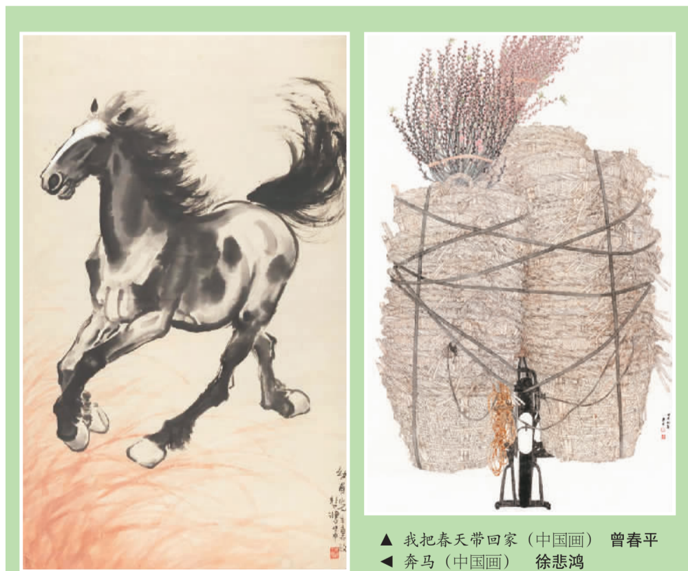
▲ 我把春天带回家（中国画）曾春平 ▲ 奔马（中国画）徐悲鸿

据悉，自2008年至今，“奥林匹克美术大会”已经举办了六届，先后从70多个国家、近2万名艺术家中，遴选出近3000位艺术家的作品参展。参展作品涵盖中国画、书法、油画、版画、综合材料绘画、雕塑等多种艺术门类。