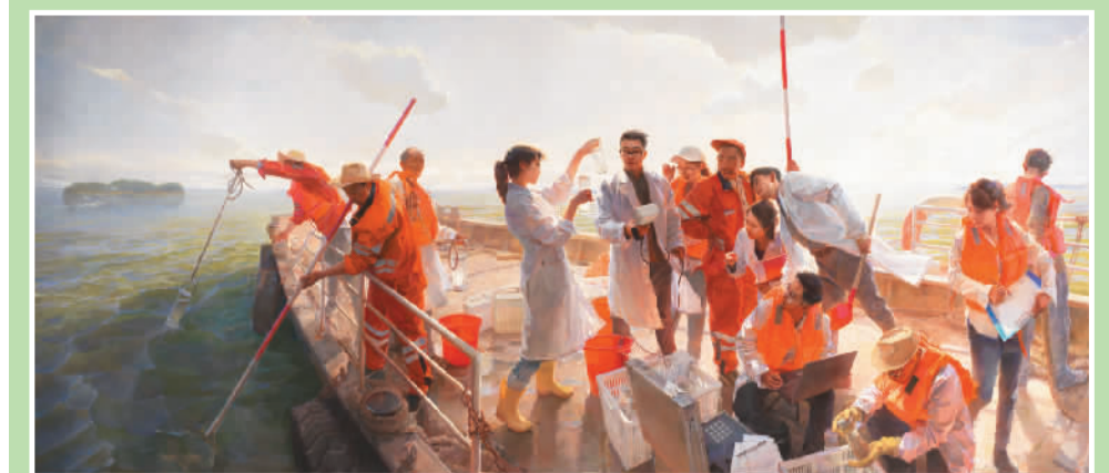
▲ 最美太湖水（油画）高亚东