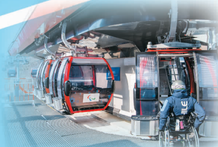
上图：2月28日，运动员在国家高山滑雪中心准备乘坐缆车。