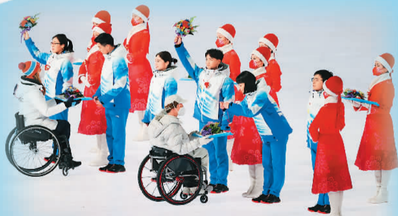
图为3月13日晚，北京2022年冬残奥会闭幕式上的向志愿者致谢环节。