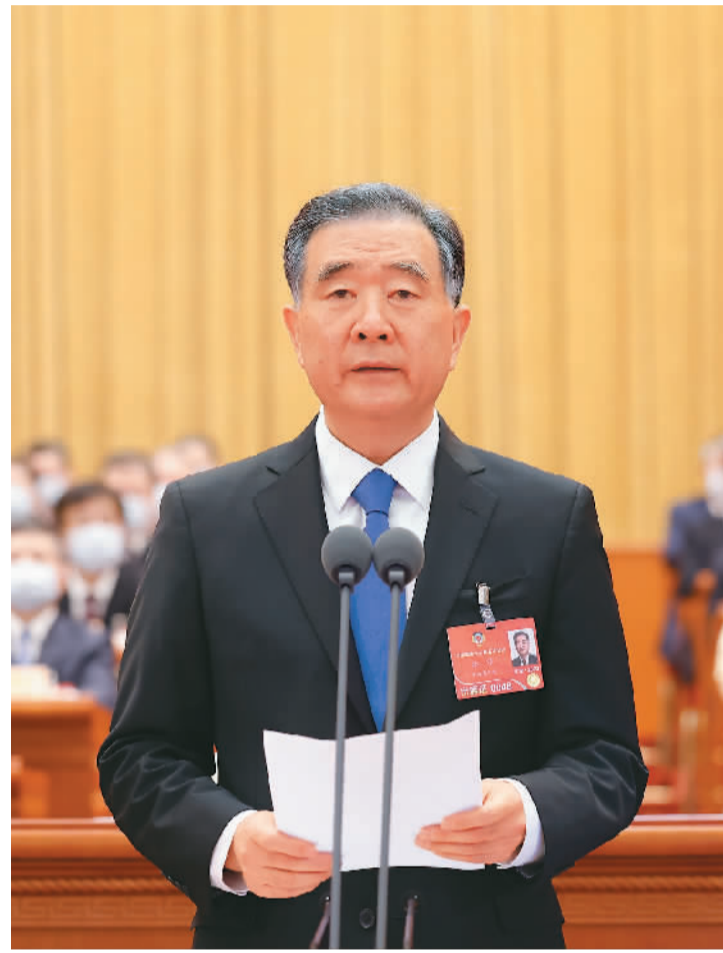
三月十日, 中国人民政治协商会议第十三届全国委员会第五次会议在北京人民大会堂闭幕。全国政协主席汪洋主持闭幕会并发表讲话。

新华社北京3月10日电 中国人民政治协商会议第十三届全国委员会第五次会议圆满完成各项议程, 10日上午在人民大会堂闭幕。会议号召, 人民政协各级组织、各参加单位和广大政协委员, 要更加紧密地团结在以习近平总书记为核心的中共中央周围, 奋发进取, 勇毅前行, 以实际行动迎接中共二十大胜利召开, 为夺取全面建设社会主义现代化国家新胜利、实现中华民族伟大复兴的中国梦作出新的更大贡献。 会议由全国政协主席汪洋主持。全国政协副主席张庆黎、刘奇葆、帕巴拉·格列朗杰、万钢、何厚铨、卢展工、马飏、陈晓光、梁振英、夏宝龙、李斌、巴特尔、汪永清、何立峰、苏辉、郑建邦、辜胜阻、刘新成、何维、邵鸿、高云龙在主席台前排就座。习近平、李克强、栗战书、王沪宁、赵乐际、韩正、王岐山等在主席台就座。上午9时, 闭幕会开始。汪洋宣布, 中