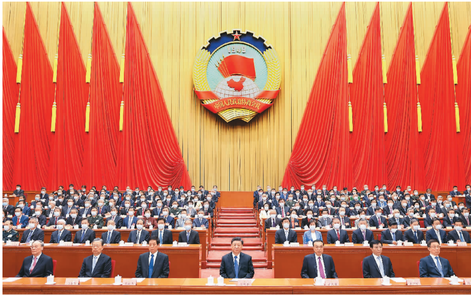
三月十日, 中国人民政治协商会议第十三届全国委员会第五次会议在北京闭幕。习近平、李克强、栗战书、王沪宁、赵乐际、韩正、王岐山等在主席台就座, 汪洋主持闭幕会并发表讲话。