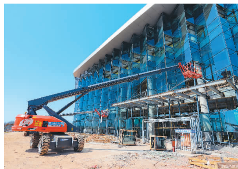
近来，江西省九江市湖口县大力推进重大项目建设，全面掀起施工热潮。图为3月9日，湖口县长江和鄱阳湖水生物保护基地正在加紧建设。

国家统计局城市司高级统计师董蔚娟分析，2月食品价格上涨1.4%，涨幅与上月相同，影响CPI上涨约0.26个百分点。其中，受春节因素影响，鲜菜、水产品价格分别上涨6%、4.8%和3%；猪肉和鸡蛋供应充足，价格分别下降4.6%和3.7%。非食品价格上涨0.4%，涨幅比上月扩大0.2个百分点，影响CPI上涨约0.34个百分点。