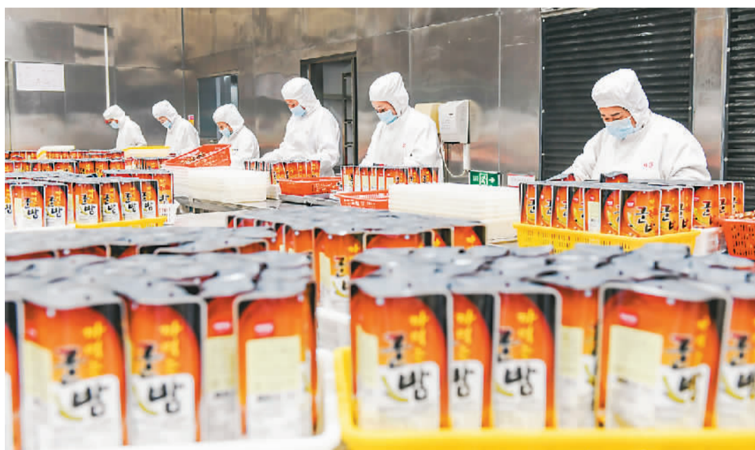
▲ 3月7日，工人在河北省遵化市苏家洼镇一家栗子加工企业车间包装出口栗子。