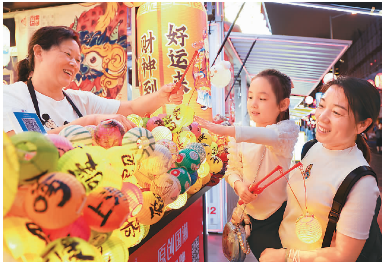
在上海豫园商城“校场”快闪街区，上美影、奈娃家族、九口山等30家新国潮品牌率先亮相，开启商业快闪街区新运营模式，变身新国货街区，吸引市民和游客前来打卡。图为游客在挑选商品。