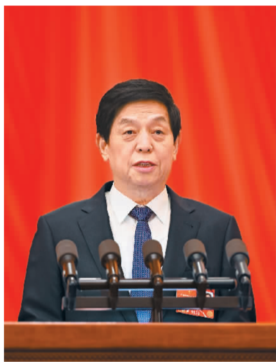
3月8日,十三届全国人大五次会议在北京人民大会堂举行第二次全体会议。栗战书作全国人大常委会工作报告,栗战书委员长向大会报告全国人大常委会工作。

新华社北京3月8日电 十三届全国人大五次会议8日上午在北京人民大会堂举行第二次全体会议,听取和审议全国人大常委会工作报告和最高人民法院工作报告、最高人民检察院工作报告。