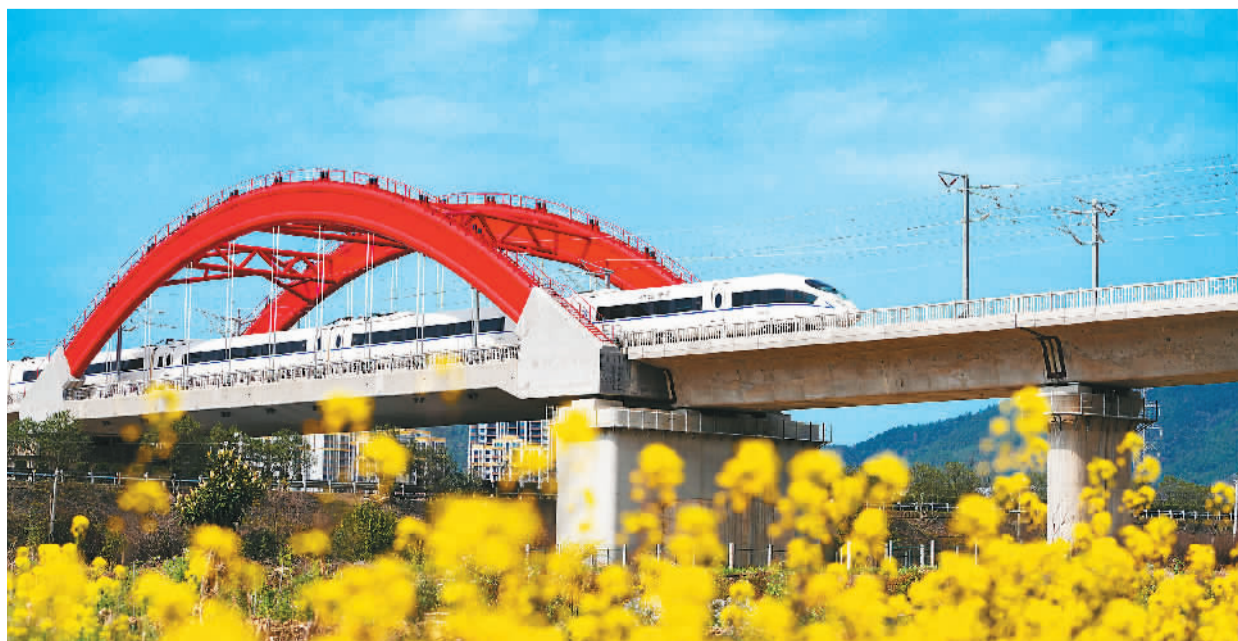
天气转暖,万物复苏,神州大地一派美丽春景。图为列车疾驰在赣深高铁江西赣州龙南段。

三、免去成竞业的中华人民共和国驻澳大利亚联邦特命全权大使职务;任命肖干为中华人民共和国驻澳大利亚联邦特命全权大使。