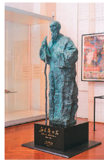
画家齐白石（雕塑）吴为山 维也纳世界博物馆藏

除了代表性的版画作品，美术日记也是此次展览的亮点之一。很长一段时间，美术日记都是李平凡创作的主要方式。他以线条和色彩替代文字，在纸上记录生活中的点点滴滴，为平凡生活赋予诗情画意。穿梭于这些尺幅不大的精美小品中，观众亦可以感受到生活的暖意和平凡而隽永的美。