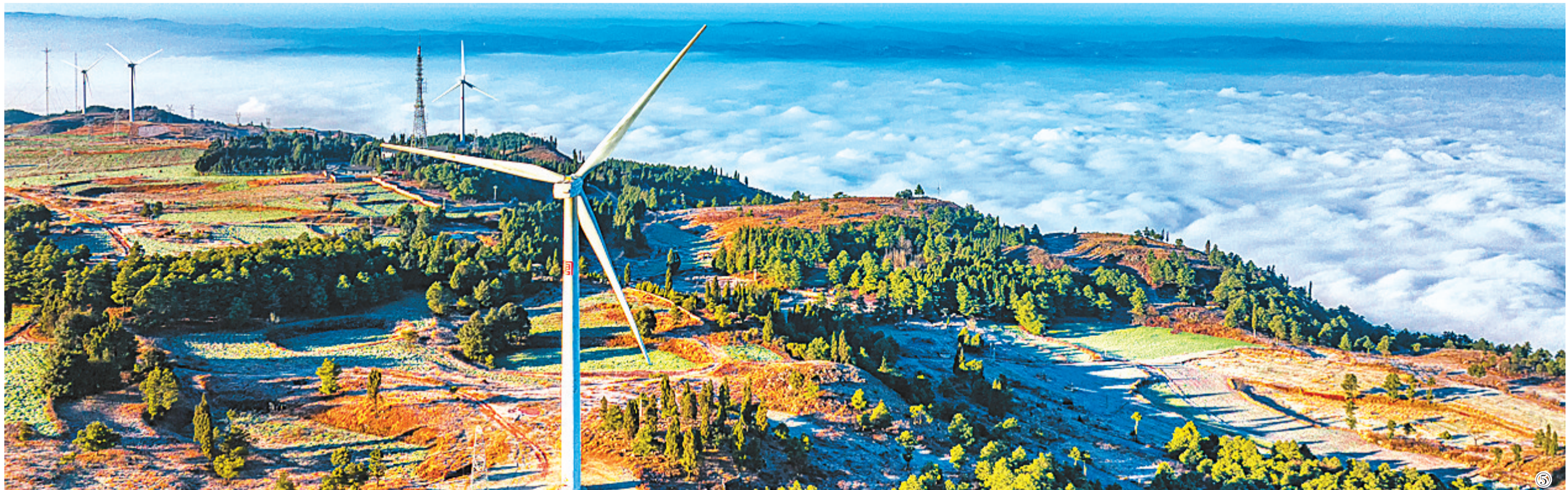
图⑤：1月18日，云南省曲靖市麒麟区朗目山风景区，风电设备、云海、树林共同构成美丽风景。