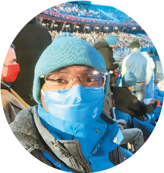
马罗在北京冬奥会闭幕式现场。