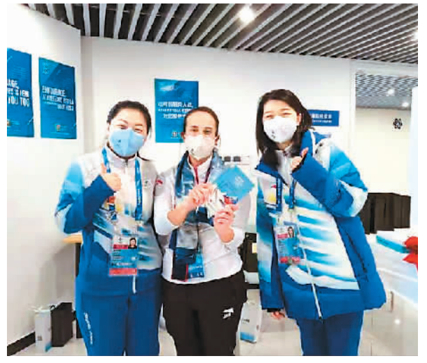
来自北京语言大学的志愿者向国际奥委会官员（中）赠送《冬奥会交际汉语口语袋书》。