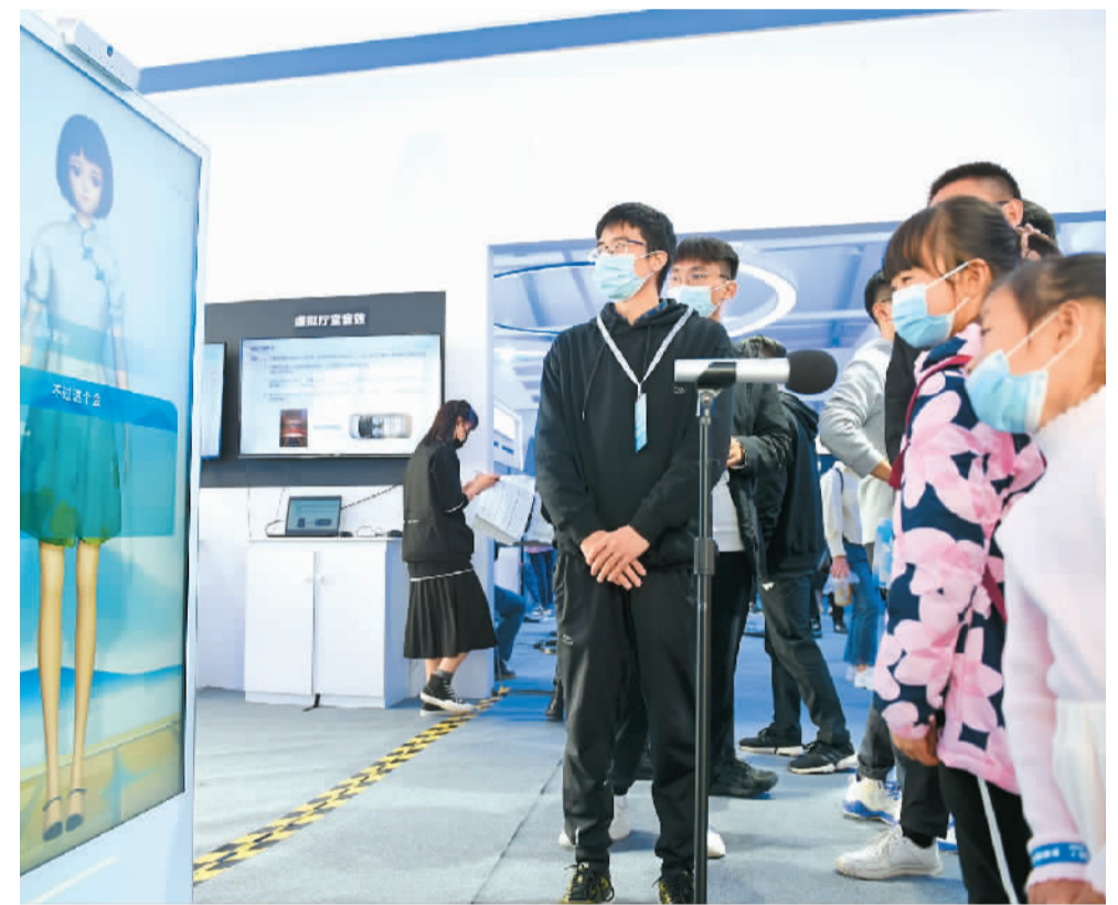
观众在第四届世界声音博览会上体验虚拟人交互。

此外,虚拟数字人缺乏行业规范,还可能引起假冒人物原型进行诈骗等违法犯罪活动。“虚拟数字人看上去与真人高度相似,跟你打视频、通电话,都可能无法分辨。”上海交通大学人工智能治理与法律研究中心秘书长何渊说,未来需要对深度合成的虚拟数字人专门立法。除了政府监管,行业各方还要有合作治理理念,提前防范相关法律伦理道德风险。