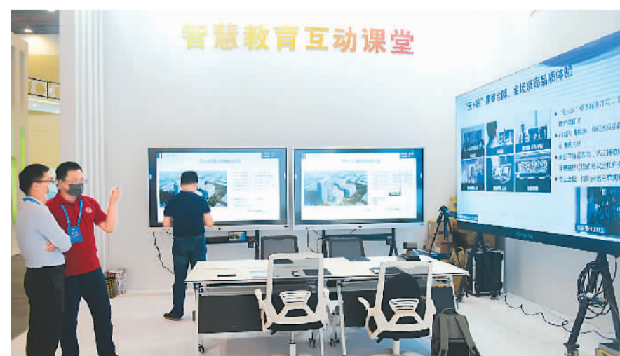
观众在第四届全球人工智能产品应用博览会上参观智慧教育互动课堂。

“5G在教育领域具有广阔的应用前景,能够优化智慧学习环境,创新学与教的形态,提高学习体验和教学效果,提升智慧教育服务水平和教育治理现代化水平,推动区域、城乡和校际教育高质量均衡发展。”北京师范大学智慧学习研究院院长黄荣怀认为,5G与教育的深度融合将进一步变革传统教育,加快移动在线教育发展,催生智慧教育新生态,践行科技与教育双向赋能命题,为未来教育发展带来新机遇。