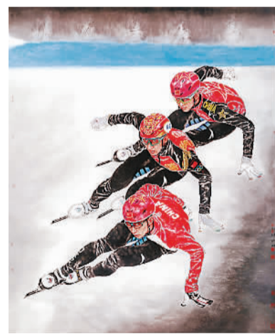
速度与激情（中国画）于文江

参展艺术家代表、中国国家画院副院长于文江表示，在此次创作中，艺术家们本着守正创新的创作要求，力求生动立体地诠释奥林匹克精神，通过冬奥题材的创作，努力展示一个生动立体的中国。