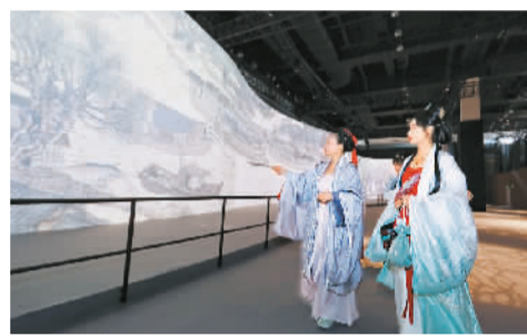
观众在江苏无锡太湖国际博览中心参观《清明上河图》数字长卷。

古画与音乐、舞蹈、影视、游戏的多维结合是当前破圈“活”化的新尝试。河南卫视《唐宫夜宴》是“绘画+舞蹈”的典型案例，以盛唐画家周昉的《簪花仕女图》为依托，人物仪态、服装、妆容和动作最大程度地还原了唐三彩乐舞俑，同时还通过虚拟现实技术再现了《捣练图》《侍马图》《备骑出行图》《明皇幸蜀图》《树下美人图》等多幅名画。“绘画+影视”有着更为丰富的实践，传统绘画可与动画、综艺、电影等嫁接共生。自1960年起，上海美术电影制片厂以中国传统水墨画为基础，先后创作了《小蝌蚪找妈妈》《牧笛》《山水情》等动画电影。中央广播电视总台推出的《国家宝藏》首期节目《千里江山图》，采用小剧场形式演绎古画传奇，讲述青绿色彩千年不腐的故事，带领观众了解《千里江山图》的“前世今生”，赋予古老厚重的文物生命气息。此外，热门手游《王者荣耀》也曾联合敦煌研究院推出敦煌壁画主题的游戏皮肤与地图设计，并发起“数字供养人”计划，让受众在参与修复敦煌壁画