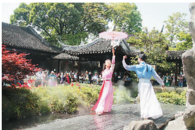
留园：演员在苏州古典园林留园表演吴地古装歌舞。