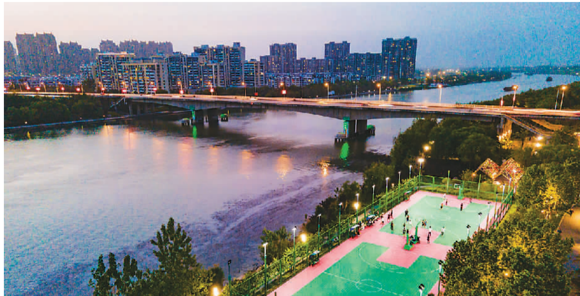
京杭大运河江苏宿迁宿豫区段，市民在河边体育公园中健身。