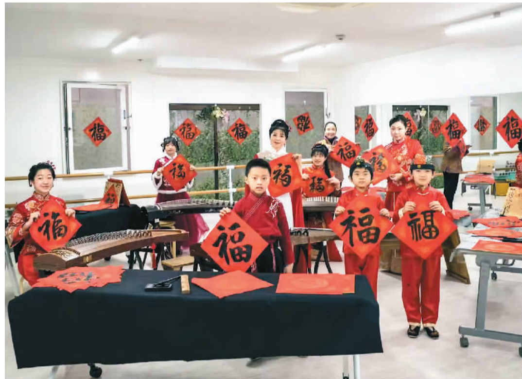
日前，日本横滨中华艺术学校主办了一场“挥春送福”活动。图为活动现场。