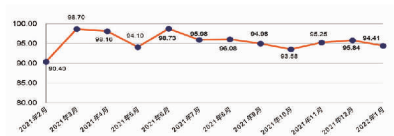
2022年1月份五金外贸景气总指数趋势图

1月份，五金产品外贸景气指数收于94.41点，较上月下降1.43点，出口势头回落。从十二大行业来看，呈现三扩张六回落三收缩格局，其中，机械设备、机电五金、电子五金三个行业处于扩张区间；门及配件、五金工具及配件、运动休闲五金、厨用五金、建筑装潢五金、通用零部件六个行业处于回落区间；车及配件、厨用五金、安防产品三个行业处于收缩区间。