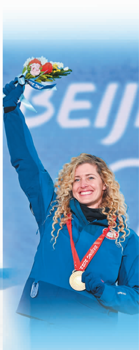
2月9日，美国选手琳赛·雅各贝利斯在奖牌颁发仪式上。她手捧的颁奖花束——绒线花是用中国传统技艺钩编而成。