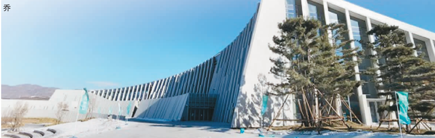
位于河北省张家口市崇礼区的华侨冰雪博物馆外景。