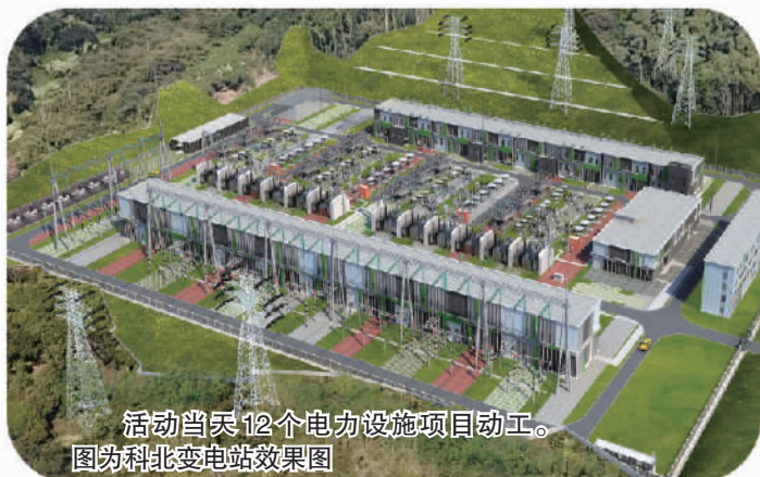
活动当天12个电力设施项目动工。图为科北变电站效果图

活动当天，48个产业项目动工，世界级新兴产业集群持续壮大。视源电子总部及智能制造基地动工建设，项目总投资33亿元，预计达产产值100亿元，将主要用于工业4.0智能主控板卡生产、智能交互整机生产、显控产品中试研究、电子新技术及软件信息研发、机器视觉和深度学习算法业务等。京信5G高端智造示范产业园项目位于广州开发区穗港智造合作区，项目将建设智能制造车间，承载5G基站