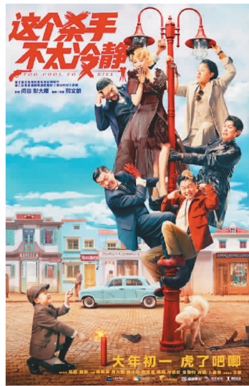
今年春节档影片《这个杀手不太冷静》海报。

此次活动由日本2022年点亮东京塔组委会、中国国际文化交流中心、中国康复技术转化及发展促进会和中华文化交流与合作促进会等单位共同举办。