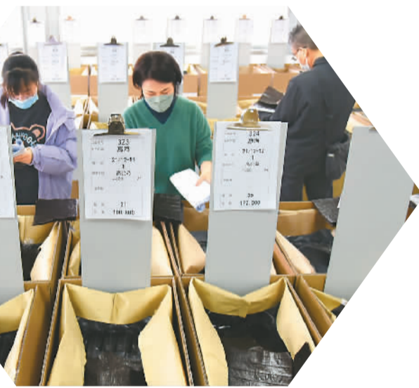
▲今年1月3日，客商在连云港紫菜交易市场选购干紫菜。当日，江苏省连云港市举办2022年度首场紫菜交易会，133家紫菜加工企业提供49486箱、共计2.37亿张干紫菜入场销售，吸引了众多中外客商到场选购交易。