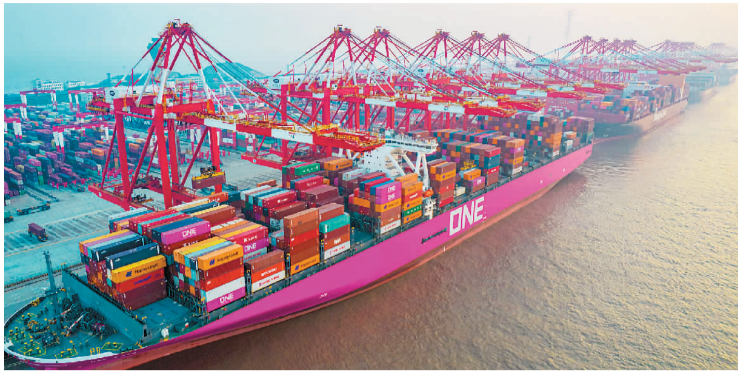
▲2021年，上海港外贸集装箱吞吐量超过3200万标箱、内贸集装箱吞吐量超过630万标箱，均实现稳步攀升。图为今年1月2日清晨，上海港洋山深水港码头，多艘大型集装箱货轮正在进行装卸作业。