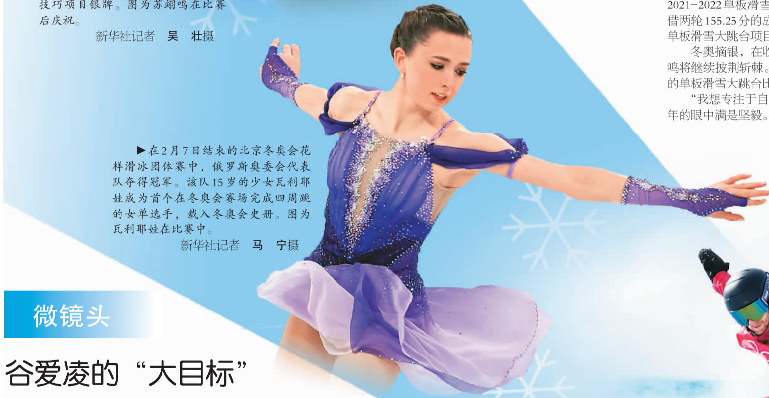
在2月7日结束的北京冬奥会花样滑冰团体赛中，俄罗斯奥委会代表队夺得冠军。该队15岁的少女瓦利耶娃成为首个在冬奥会赛场完成四周跳的女单选手，载入冬奥会史册。图为瓦利耶娃在比赛中。