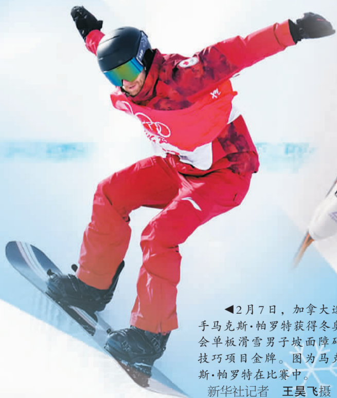
2月7日，加拿大选手马克斯·帕罗特获得冬奥会单板滑雪男子坡面障碍技巧项目金牌。图为马克斯·帕罗特在比赛中。