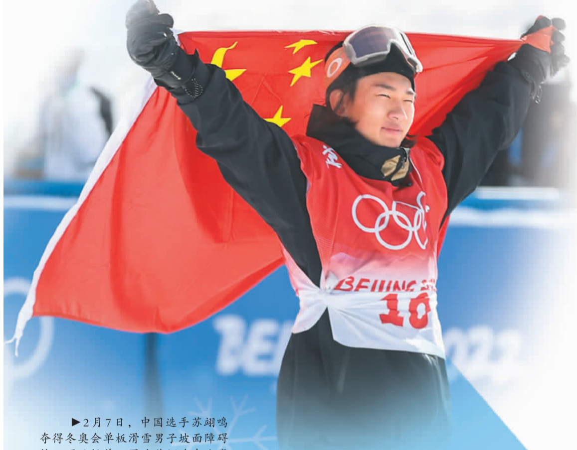
2月7日，中国选手苏翊鸣夺得冬奥会单板滑雪男子坡面障碍技巧项目银牌。图为苏翊鸣在比赛后庆祝。