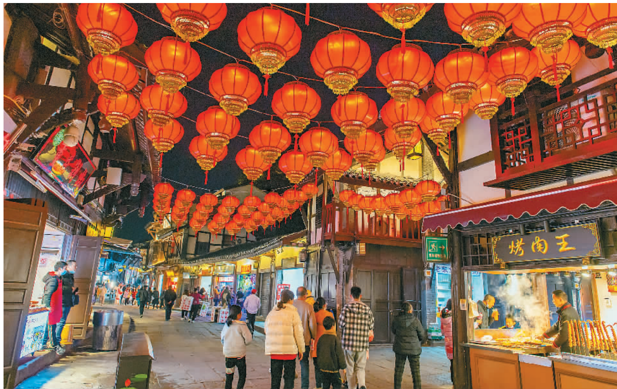
重庆市沙坪坝区磁器口古镇流光溢彩，欢度春节。

在中国人家，除夕的团圆饭堪称是一年中最重要的、也最豪华的一顿饭。每当此时，远在天涯的家庭成员，不辞千里，排除万难，也要赶回来吃这顿饭，为的是一家团圆，互祝平安，图个吉利。