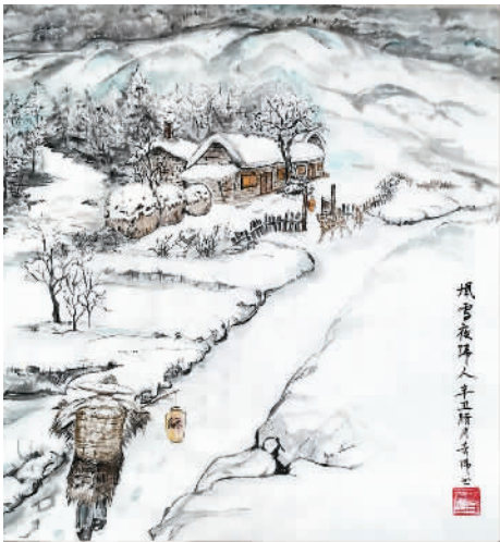
风雪夜归人。满奇伟绘

记得那些菜肴用的食材品种繁多，蔬菜类的有胶东大白菜、菠菜、盖菜、绿豆芽、胡萝卜、白萝卜、冬笋和茭白；豆制品类有豆腐、油炸豆腐、面筋、豆腐丝、粉丝；干货类有木耳、香菇、黄花菜、海带、紫菜等。这些原料经过母亲的巧手，幻化成一道道色彩鲜艳、搭配和谐、极富审美效果的精美菜肴。比如木耳芽