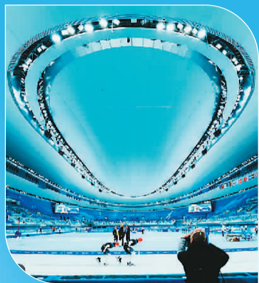
图为德国速度滑冰运动员费利克斯·里吉亨在社交媒体上发文时的配图。