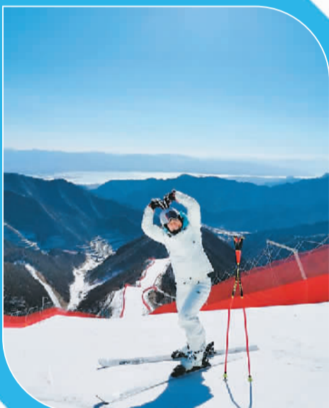
图为瑞士高山滑雪运动员温蒂·霍尔德纳在社交媒体上发文时的配图。