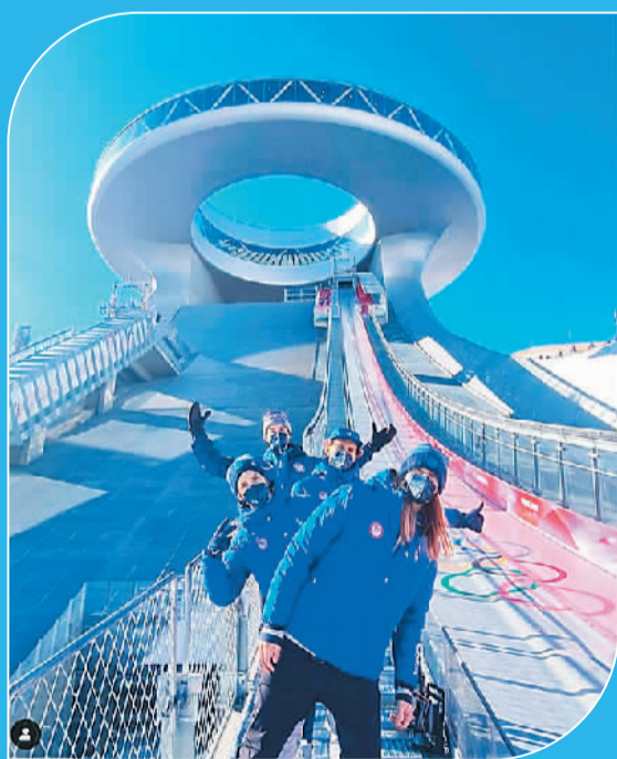
图为美国滑雪队在社交媒体上发文时的配图。