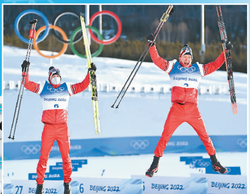
▲2月6日，俄罗斯奥委会选手亚历山大·博利舒诺夫（右）和丹尼斯·斯皮佐夫分别摘得冬奥会越野滑雪男子双追逐（15公里传统技术+15公里自由技术）金牌、银牌。因为他们在颁奖仪式上高高兴兴地庆祝。