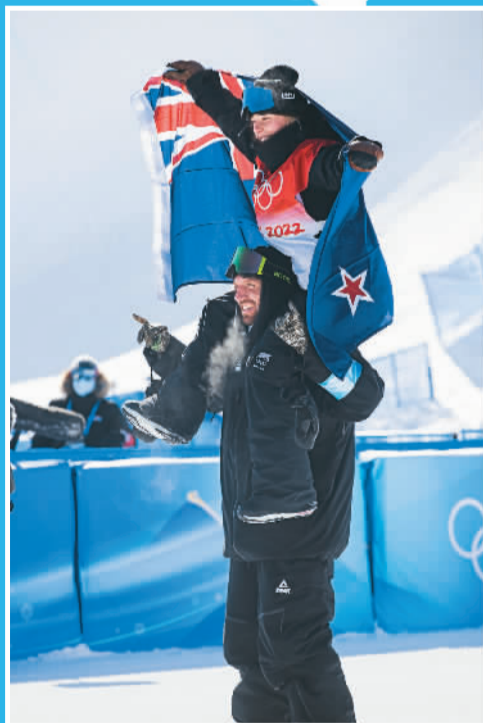
▲2月6日，新西兰选手佐伊·萨多夫斯基·辛诺特（上）夺得冬奥会单板滑雪项目女子坡面障碍技巧冠军。