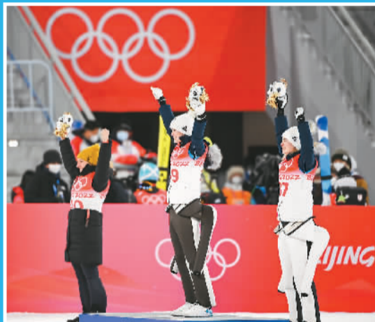
▲2月5日，斯洛文尼亚选手乌尔萨·博加塔伊（中）德国选手卡塔琳娜·阿尔特豪斯（左）斯洛文尼亚选手妮卡·克里兹纳尔分别夺得冬奥会跳台滑雪女子个人标准台冠军、亚军、季军。