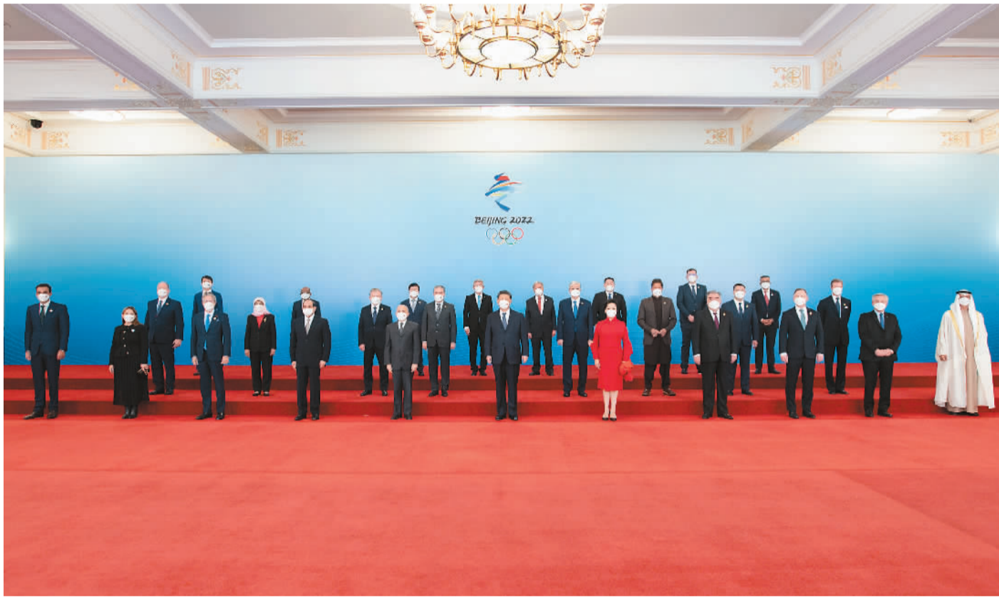
2月5日中午, 国家主席习近平和夫人彭丽媛在北京人民大会堂金色大厅举行宴会, 欢迎出席北京2022年冬奥会开幕式的国际贵宾。图为习近平和彭丽媛同国际贵宾一起合影留念。

新华社北京2月5日电 国家主席习近平和夫人彭丽媛2月5日中午在北京人民大会堂金色大厅举行宴会, 欢迎出席北京2022年冬奥会开幕式的国际贵宾。