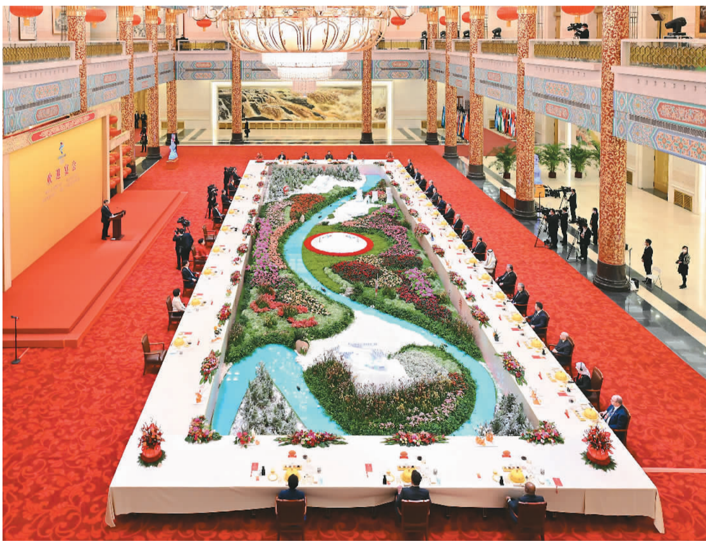
2月5日中午, 国家主席习近平和夫人彭丽媛在北京人民大会堂金色大厅举行宴会, 欢迎出席北京2022年冬奥会开幕式的国际贵宾。