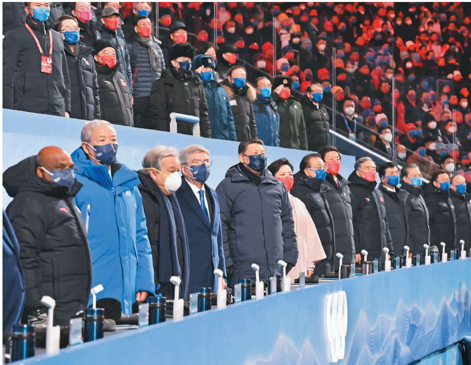
2月4日晚,北京第二十四届冬季奥林匹克运动会开幕式在国家体育场隆重举行。习近平、李克强、栗战书、汪洋、王沪宁、赵乐际、韩正、王岐山等党和国家领导人出席开幕式。

新华社北京2月4日电 筑梦冰雪,同向未来。2022年2月4日晚,举世瞩目的北京第二十四届冬季奥林匹克运动会开幕式在国家体育场隆重举行。国家主席习近平出席开幕式并宣布本届冬奥会开幕。中华文明与奥林匹克运动再度携手,奏响全人类团结、和平、友谊的华美乐章。