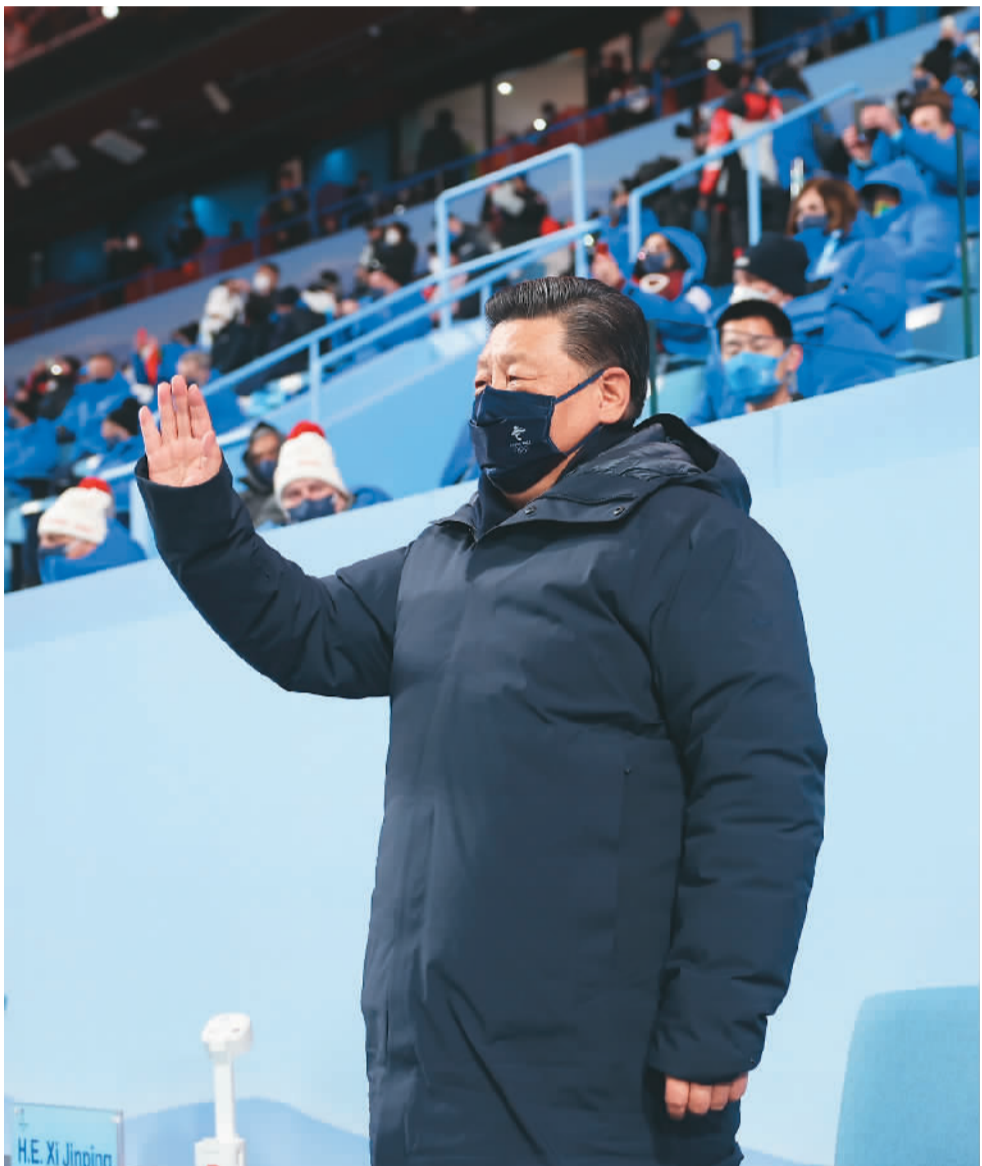
2月4日晚,北京第二十四届冬季奥林匹克运动会开幕式在国家体育场隆重举行。图为国家主席习近平在主席台上向大家挥手致意。

李克强栗战书汪洋王沪宁赵乐际韩正王岐山 国际奥委会主席巴赫 来自世界各地的领导人和贵宾等出席