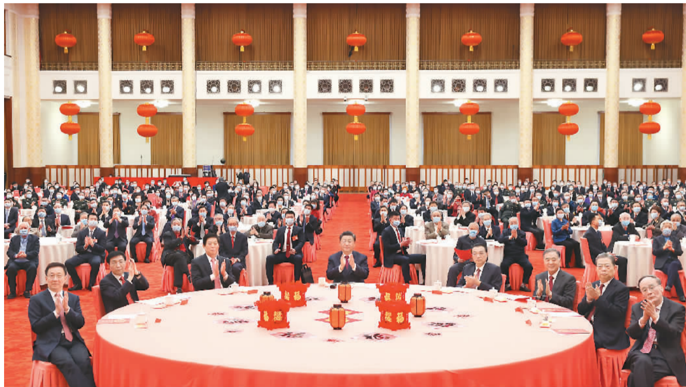
1月30日,中共中央、国务院在北京人民大会堂举行2022年春节团拜会。党和国家领导人习近平、李克强、栗战书、汪洋、王沪宁、赵乐际、韩正、王岐山等同首都各界人士欢聚一堂,共迎新春。