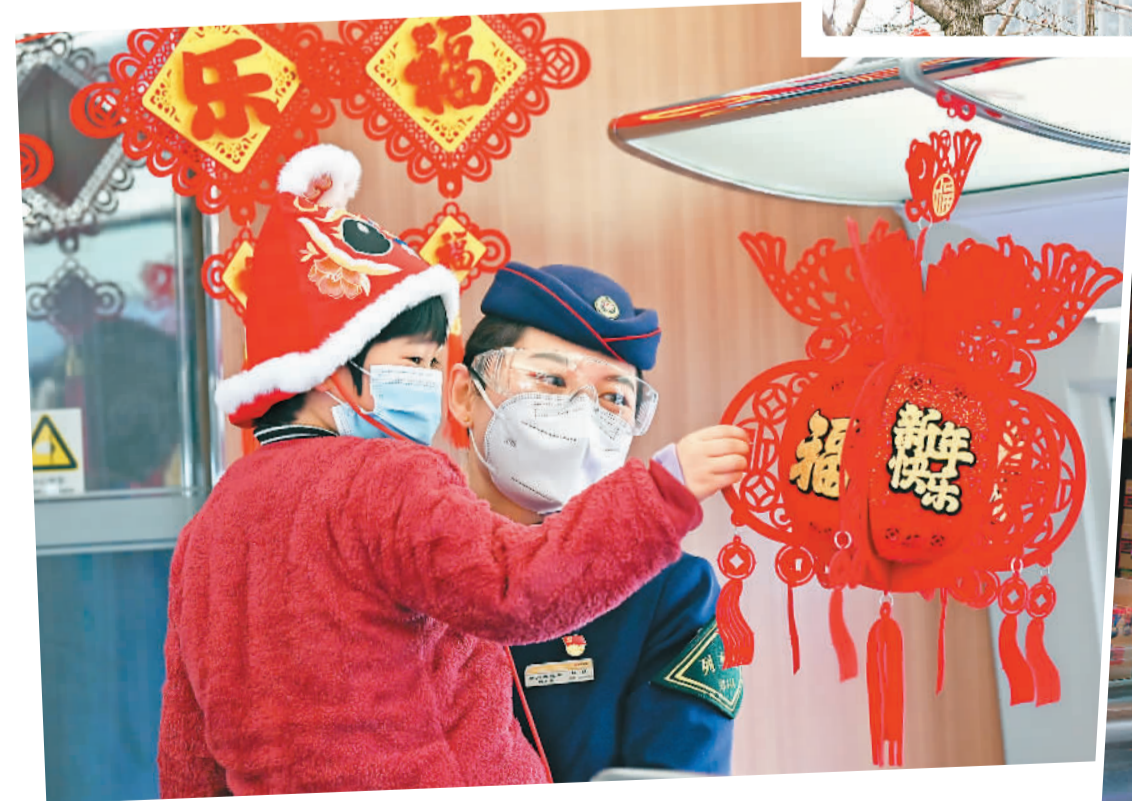
▲春运旅途中也有着浓厚的新春氛围。图为G7944次高铁乘务员与小旅客互动。 ▶侨乡广东省江门市蓬江区新市路沿街店铺挂满灯笼、春联等节日饰品，年味正浓。