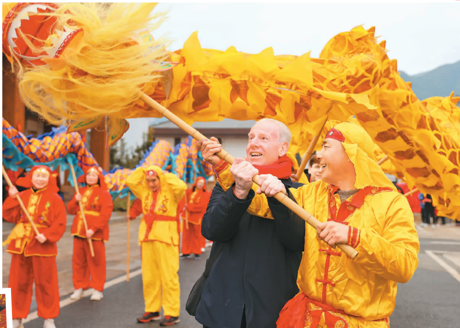
▲浙江省湖州市德清县莫干山镇仙潭村，在当地工作生活的国际友人来到乡村体验舞龙等中国传统民俗活动。

春节临近，神州大地处处洋溢着红红火火的节日氛围。在城市街头巷尾，在广袤的乡野村落，人们备年货、赏民俗，在浓浓的年味中迎接农历虎新春的到来。