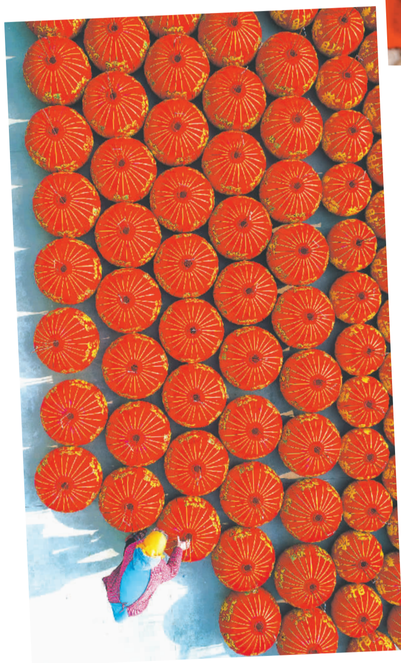
▲江苏省海安市墩头镇毛庄村村民在制作供应春节市场的大红灯笼。 ▶在江西省赣州市章贡区赣康路上，工作人员悬挂红灯笼。