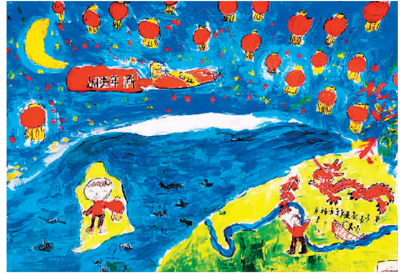
《故乡在那头 我在这头》 张熙骅 (9岁) 作 (寄自英国)