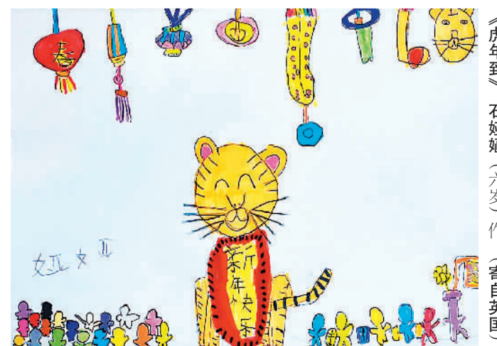
《虎年到》 石妍妍 (六岁) 作 (寄自英国)