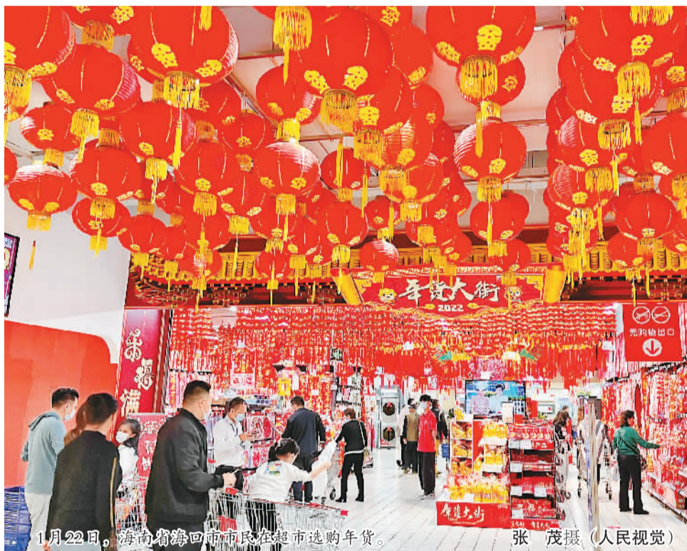
1月22日，海南省海口市市民在超市选购年货。