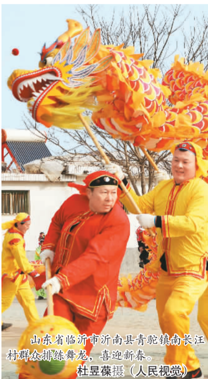
山东省临沂市沂南县青驼镇南长汪村群众排练舞龙，喜迎新春。