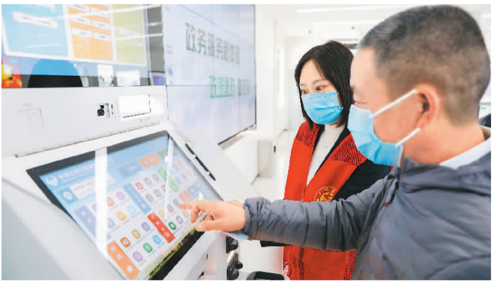
在河南省平顶山市宝丰县一处“政银通办”政务服务代办网点，工作人员帮助市民通过自助设备办理业务。

低保网上申报、跨省婚姻登记、居家养老“预约到办”……随着中国政务数字化建设不断推进，越来越多的民政机构在做好线下服务的同时，依托网络平台开辟线上便民服务新路径，打通便民服务最后一公里。民政部近日印发《“十四五”民政信息化发展规划》，要求进一步深化“互联网+民政服务”，将数字技术广泛应用于民政领域治理和服务，推动更多民政服务事项“一网通办”“跨省通办”“就近可办”。