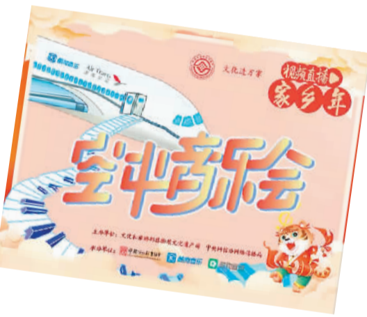
“空中音乐会”海报

拍摄手段上，该片突出电影化与大众化科普手段，以4K超高清高品质影像与网络智能化生活场景呈现，画面精致，视听冲击力强，充