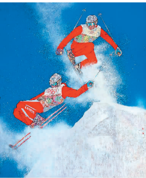
巅峰舞雪（中国画） 高毅、黄华三