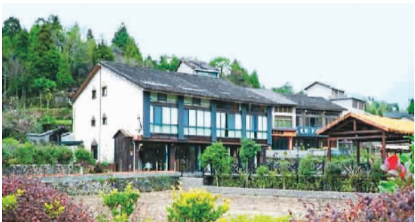
浙江文成的一家“侨家乐”民宿。

冬天本是一年民宿生意黯淡的时节。然而，在浙江省温州市文成县，以“侨家乐”为品牌的民宿联盟却不愁客源。文成是著名侨乡，百年华侨文化影响深远，约有16.8万华侨华人分布在全球70多个国家和地区。近年来，文成县“侨家乐”品牌民宿办得红红火火，成为浙江省三大区域民宿品牌之一。