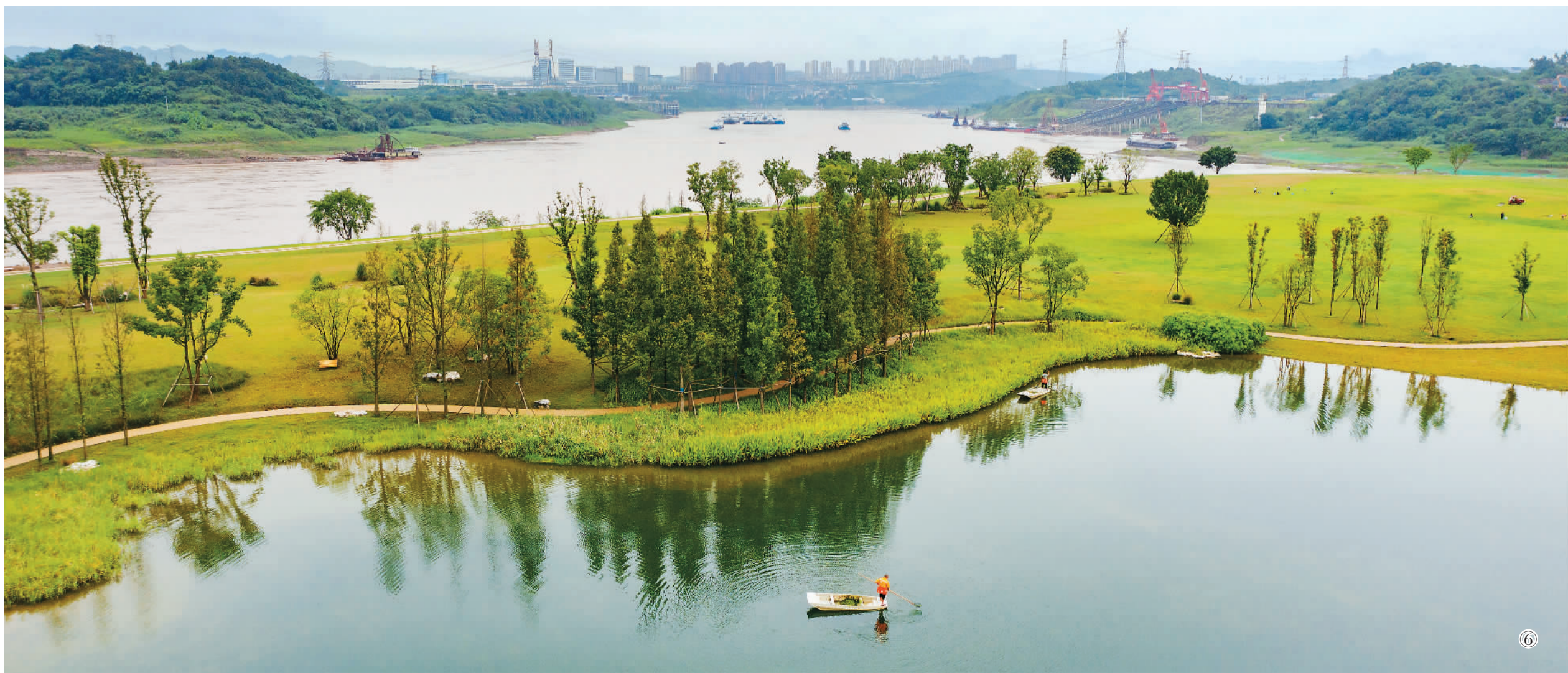
图⑥：2021年8月15日，生态修复工人在广阳岛燕子坪清洁湖水。