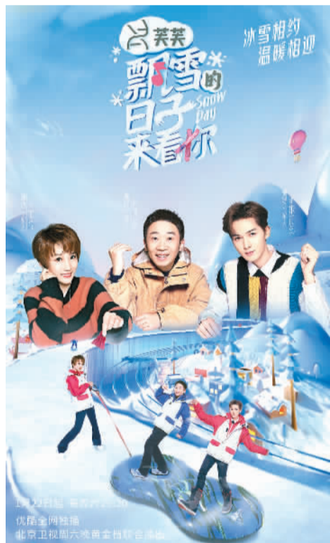
《飘雪的日子来看你》海报 出品方供图