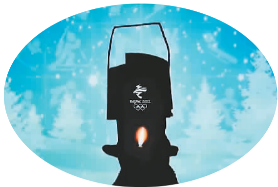
《冰雪聪明》节目中的奥运火种灯

《冬日暖央young》以“燃情冰雪季,主播嘉年华”为口号,集合中央广播电视总台众多优秀主持人组成战队,以文艺竞演+冰雪运动的创新形式,用主持人的第一视角和年轻化、幽默化的语态,推广冰雪