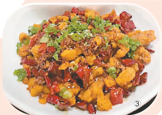
“老四川”招牌菜品： 图①：北京烤鸡。 图②：柠檬脆皮虾。 图③：香辣仔鸡。

报》评选的芝加哥地标菜，樟茶鸭等菜品入选芝加哥最佳菜式。芝加哥许多知名政客都有各自喜爱的“老四川”菜品。芝加哥主流社会把我称作“中餐界的李小龙”，《芝加哥论坛报》授予我社区英雄奖，我连续两届入选权威杂志《芝加哥杂志》“芝加哥最具影响力百人榜”，是100多年来榜单中唯一的亚裔成员。我一直认为，这些荣誉不属于我个人，而是属于充满魅力的中国川菜。让美国人爱上正宗川味，这个创业之初的“执念”，我终于实现了！