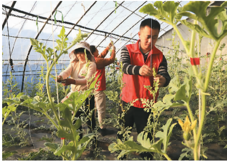
近来，江苏省东台市国家现代农业产业园种植的冬季西瓜开始开花坐果。园区管理团队组织技术骨干走进温室大棚，指导瓜农整枝打杈、人工授粉，实行精准管护。

2021年，是“三农”工作重心转向全面推进乡村振兴的第一年。这一年，相关工作成效如何？1月20日，国新办举行新闻发布会，农业农村部总农艺师、发展规划司司长曾衍德在会上介绍，总的看，2021年农业农村改革发展取得显著成效。今年，农业农村部将牢牢守住保障国家粮食安全和不发生规模性返贫两条底线，扎实有序推进乡村发展、乡村建设、乡村治理重点工作。