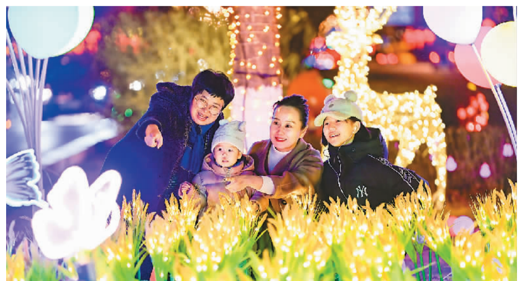
1月19日晚，内蒙古自治区呼和浩特市赛罕区“迎新春·送祝福·欢乐过大年”主题城市街景亮化景观整体亮灯，道路两旁、公园广场张灯结彩，火树银花，如梦似幻，迎接即将到来的新春佳节。图为游客在赛罕区东二环路观赏街景亮化景观。

上海“五个中心”建设持续推进。2021年持牌金融机构新增58家，金融市场交易总额突破2500万亿元、增长10.4%。国际贸易中心能级大幅提升，口岸贸易总额保持世界首位，千亿级大宗商品交易平台达到7家，上海港集装箱吞吐量达到4703.3万标准箱。实际使用外资达到225.5亿美元，增长11.5%；新增跨国公司地区总部60家，新增外资研发中心25家。