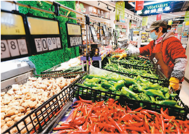
2021年全年，全国居民消费价格指数(CPI)比上年上涨0.9%，低于全年3%左右的预期目标。图为近日，在江西省吉安市峡江县一家超市，售货员在整理货架。