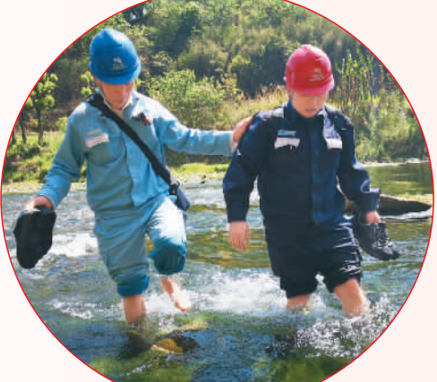
大坡供电所员工蹚水前往双河村开展保春耕线路隐患排查。

服务群众，离不开心中有数。将业务烂熟于心是基层工作人员的职责所在，为民办实事则是看得见、摸得着的工作成效。只有把基础工作做扎实，才能真正提高群众的获得感。