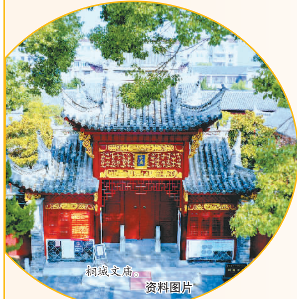
桐城文庙。资料图片

桐城市位于安徽省中部偏西南、大别山东麓、长江北岸，有长达1200多年的建城史。桐城古城东大街、北大街、胜利街、南大街传统街区是纵贯历史城区的主干街