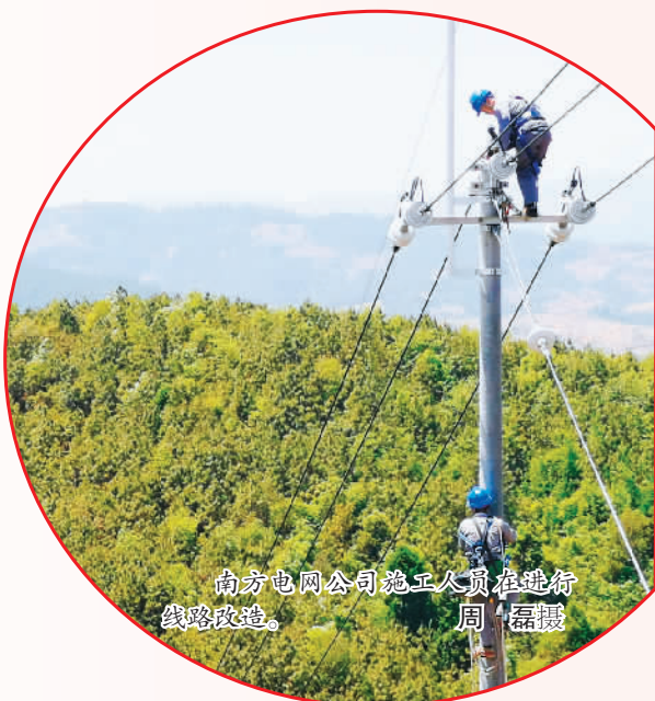
南方电网公司施工人员在进行线路改造。

“咱们电网虽然是企业，可也是保障基本民生的企业，我们工作细致些，动作麻利点，群众生产生活就方便些，社会运转就高效些。”周磊介绍，从最初的308个台区扩建到今天的351个台区，大坡乡的手绘地图也经过了修改、反复更新，员工们累