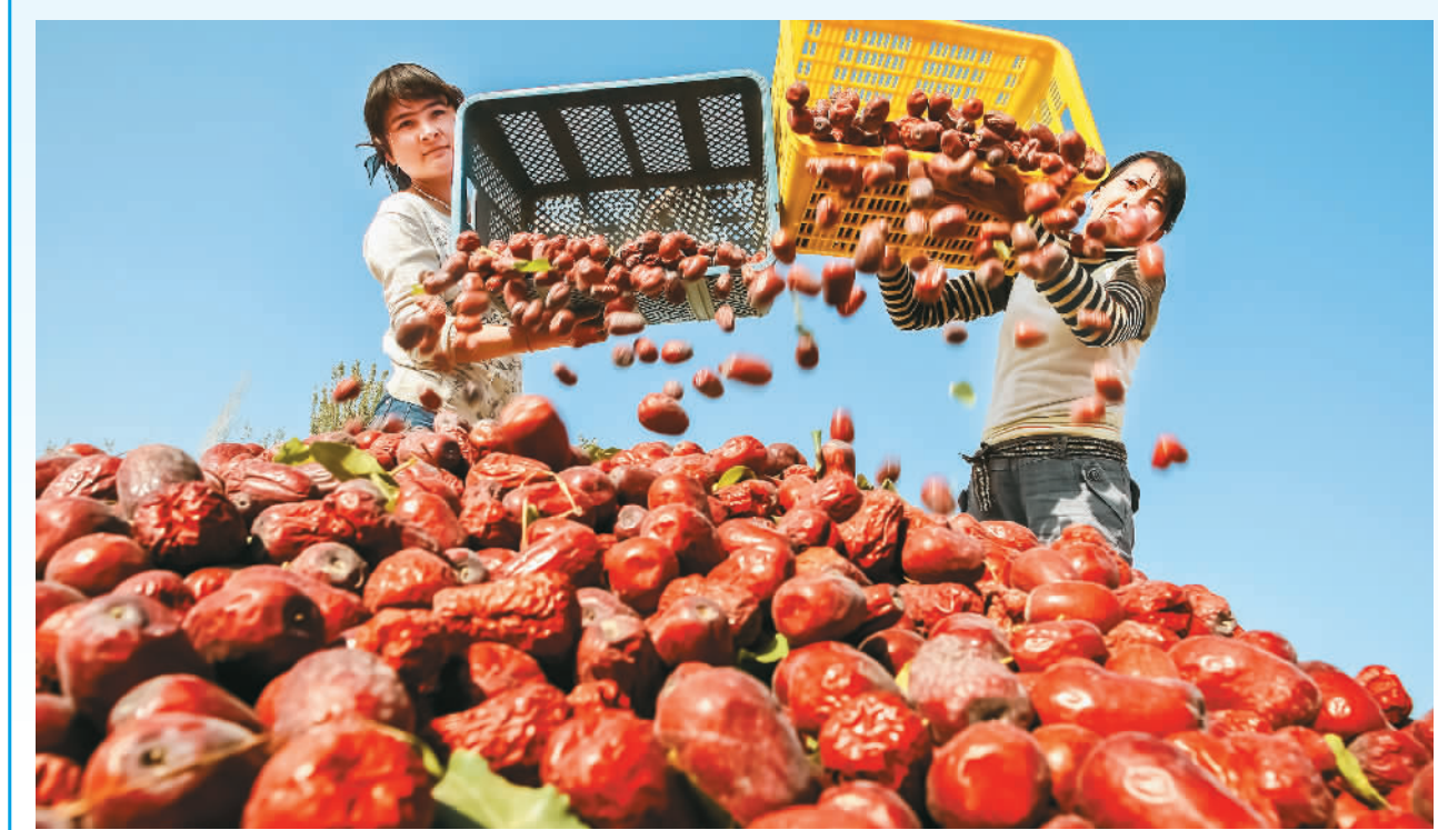
近日，新疆维吾尔自治区喀什地区“泽普骏枣”获国家地理标志证明商标注册证书，这是喀什地区的第11件地理标志商标。喀什地区通过加快“一县一品”地理标志商标建设，推进特色产业高质量发展。图为泽普县阿克塔木乡阿勒图克艾日克村村民正在采收骏枣。

对待历史文化遗存，要尽可能保留原貌，使其“延年益寿”，望其“返老还童”，而不是“破旧立新”。古城保护，保护的是古城，更是文化和历史。时代不同，需求会变，审美会改，但一草一木、一砖一瓦里的基因和回忆，自会岿然不动。