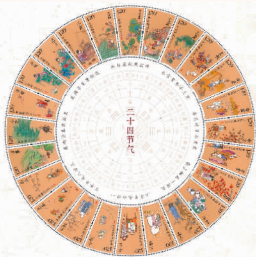
《二十四节气》特种邮票