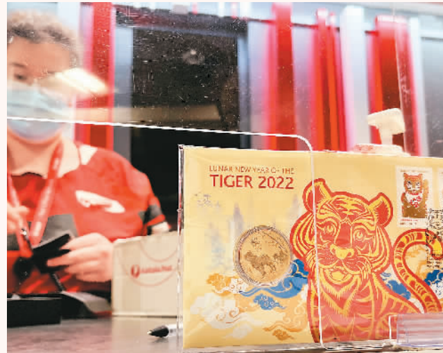
1月13日在澳大利亚悉尼一家邮政局拍摄的虎年生肖邮票和纪念封。