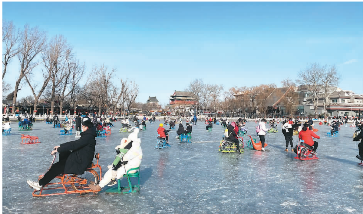
游客在什刹海冰场感受冰上运动的乐趣。

老北京冰雪运动发展颇有历史和群众基础。1925年，北海公园开始向普通民众开放，并在冬天开放冰场；上世纪50年代，什刹海开辟天然溜冰场，并提供冰鞋出租服务；到了上世纪七八十年代，什刹海冰场与北大未名湖冰场、北海公园冰场、中山公园冰场、颐和园昆明湖冰场等天然冰场，成为北京市民参与冰上运动的主要场所，热度延续至今。