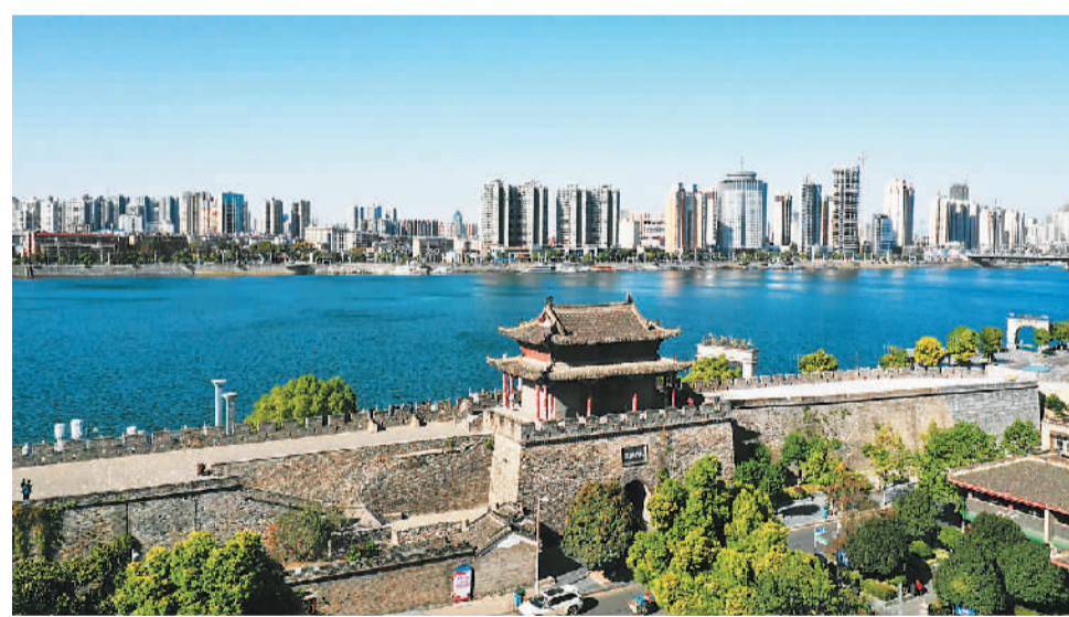
汉江流经襄阳。

三千里汉江，出秦岭，过巴山，一路穿山越岭，向东奔走，滋养了无数动植物，也滋养了繁盛人烟。