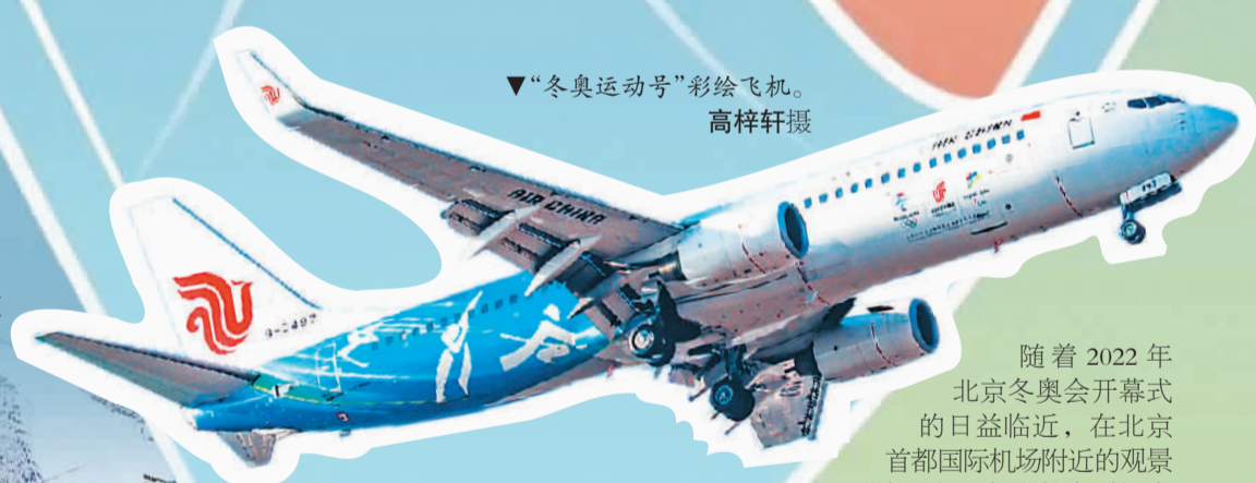
“冬奥运动号”彩绘飞机。