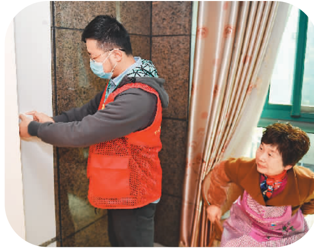
▲2021年11月17日，在浙江省湖州市吴兴区爱山街道龙庭小区，智慧养老综合服务平台的工作人员（左）在居民家中安装“一键帮助”服务设备。