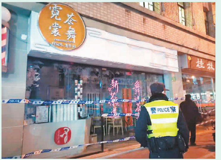
图为被划为高风险地区的上海某奶茶店。

专家表示，随着5G等互联网技术的普及应用，“互联网+医疗”在促进优质医疗服务资源下沉、提升基层医院服务水平等方面将大有作为，未来将有更多群众在家门口就能享受方便、快捷的优质医疗服务。