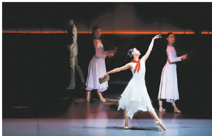
《我的名字叫丁香》剧照

动人的芭蕾舞姿，恢宏的交响音乐，感人的故事情节……1月7日晚，苏州芭蕾舞团原创芭蕾舞剧《我的名字叫丁香》作为“相约北京 遇见江南”苏州文化艺术展示周开幕演出，在北京天桥艺术中心上演。此次苏州文化艺术展示周是“相约北京”国际艺术节的一个重要组成部分，从1月6日至20日，活动将以精品剧目展演、“苏州年味”体验周、非遗纪录电影放映等形式，展示极具江南质感的原味姑苏。