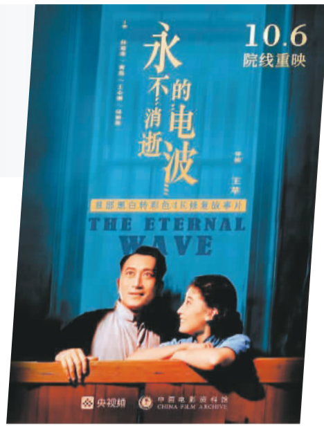
首部黑白转彩色4K修复故事片《永不消逝的电波》海报

平台也陆续加入到电影修复的队伍中。爱奇艺和新派系文化传媒联手修复的《护士日记》先后于2018年第21届上海国际电影节“向大师致敬”单元和2019年第72届戛纳国际电影节“戛纳经典”单元放映，这部展示中华人民共和国成立初期社会状况和人民精神面貌的影片在海内外引发广泛关注，在爱奇艺平台上也获得了大量用户好评。