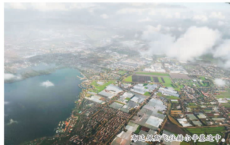
布达佩斯飞往赫尔辛基途中。

我想，这是疫情期间有出国回国经历的人都有过的故事，或许也是新冠肺炎疫情下不同于往日的特别记录。但愿，这样的记录早日成为过去式。