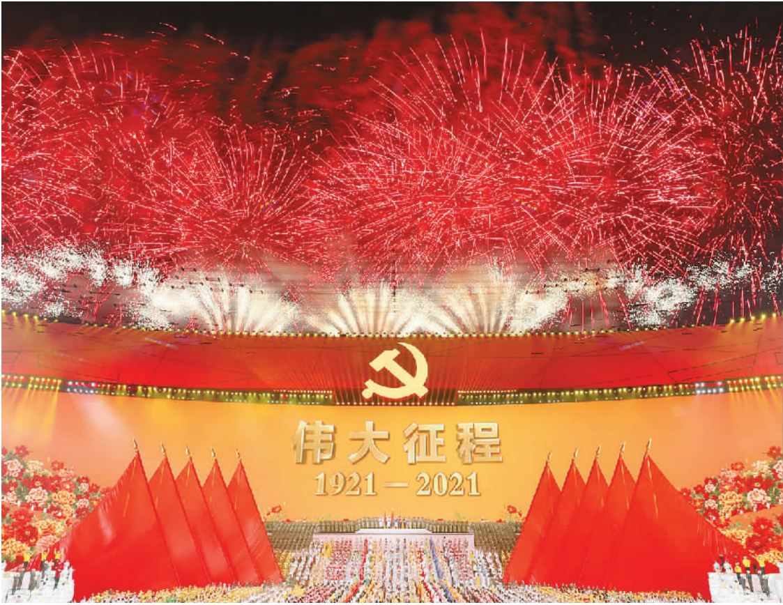
▲ 2021年6月28日晚，庆祝中国共产党成立100周年文艺演出《伟大征程》在北京国家体育场盛大举行。图为文艺演出结束，全场共同高唱《没有共产党就没有新中国》。

记忆犹新。 他们中，有“初生牛犊不怕虎”。“跳水新星”全红婵以三跳满分的成绩夺得女子单人十米跳台金牌。赛后，教练将她高高托起，并在采访中透露，全红婵每天的训练量以百次计，每次训练都全力以赴，“她值得她的成绩”。 他们中，有“老骥伏枥志在千里”。32岁的老将苏炳添在男子100米半决赛中以9秒83的成绩打破亚洲纪录，这份震撼和感动无法用奖牌衡量。赛后采访中，苏炳添说：“我希望年轻一辈继续发扬这个项目。我相信中国的短跑总有一天会站上领奖台！” 他们中，有“赢得起”更有“赢得有风格”。在乒乓球女单颁奖仪式上，金牌得主陈梦主动邀请日本运动员伊藤美诚一起登上最高领奖台合影；在羽毛球女单1/8决赛中，何冰娇面对对手意外因伤退赛而难过落泪，“如果可以的话，我想好好跟她拼完这场球”；汪顺在夺得男子200米个人混合泳金牌之后，在泳池边上向连续参加5届奥运会的匈牙利泳坛老将鞠躬致敬……中国健儿阳光、自信、真诚的形象，让世界看到了更加开放包容的中国。 2021年过去了，但这一年中国共产党带领中国人民的奋斗，中国出彩的华章，却永远写入了史册。