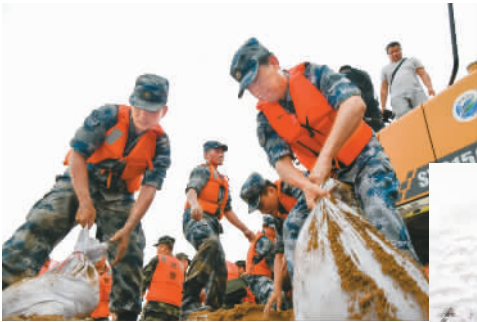
▲ 2021年，全国支援河南防汛救灾。图为2021年7月23日，空军某汽车运输团官兵在加固河南省长葛市南席镇马武村双洎河沿岸堤坝。

3个月，于9月17日顺利返回。 2021年10月16日，神舟十三号载人飞船发射成功，把航天员翟志刚、王亚平、叶光富顺利送入太空。这次，3名航天员将开启为期6个月的在轨驻留。无论神舟十二号穿云破日、光耀四方，还是神舟十三号与月亮浪漫同框，这一年的中国，都想让人抬头看天。 也许并不让人意外的是，2021年，中国航天发射次数达55次，位居世界第一。在中国各行各业，这一年与之相伴的还有很多项“世界第一”，2021年，全球成交的新船订单量是1846艘4573万修正总吨，而中国承接的有965艘2280万修正总吨，位列全球首位；中国电影票房总收入超过74亿美元，连续两年成为世界冠军…… 2021年两会上，习近平总书记一席话，为我们提供了最好的解释。“70后、80后、90后、00后，他们走出去看世界之前，中国已经可以平视这个世界了，也不像我们当年那么‘土’了……”